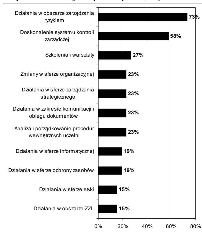
Rys. 3. Planowane działania mające na celu usprawnienie funkcjonowania kontroli zarządczej w badanych publicznych szkołach wyższych na 2012 rok

uczelni), a także dalszego doskonalenia systemu kontroli zarządczej (w 58% badanych podmiotów). W mniejszym zakresie planowane jest natomiast organizowanie szkoleń i warsztatów dla pracowników, a także podejmowanie działania w innych sferach funkcjonalnych zarządzania, co przedstawiono na rys. 3.